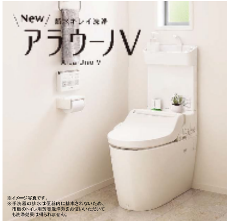
※イメージ写真です。 ※手洗器の排水は便器内に排水されないため、市販のトイレ用芳香洗浄剤をお使いいただいても洗浄効果は得られません。