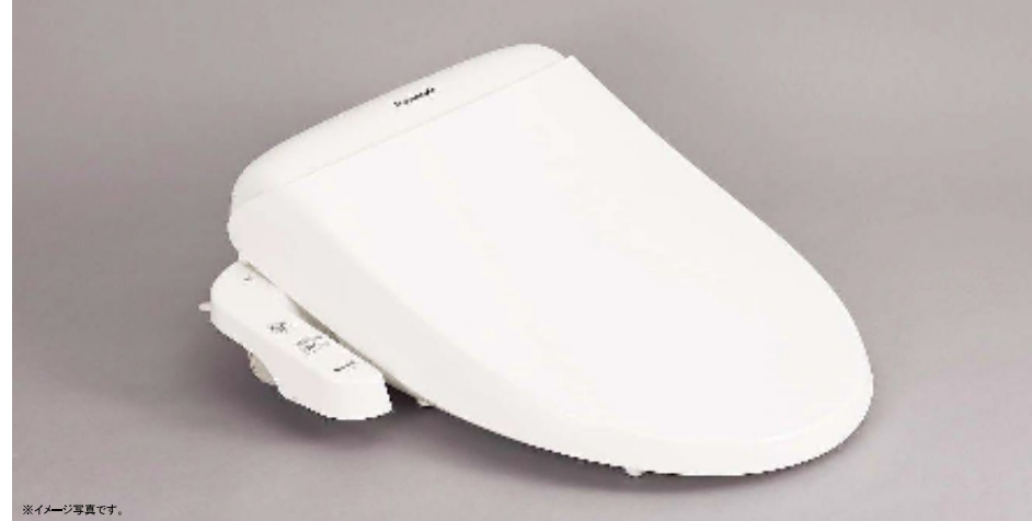
※イメージ写真です。