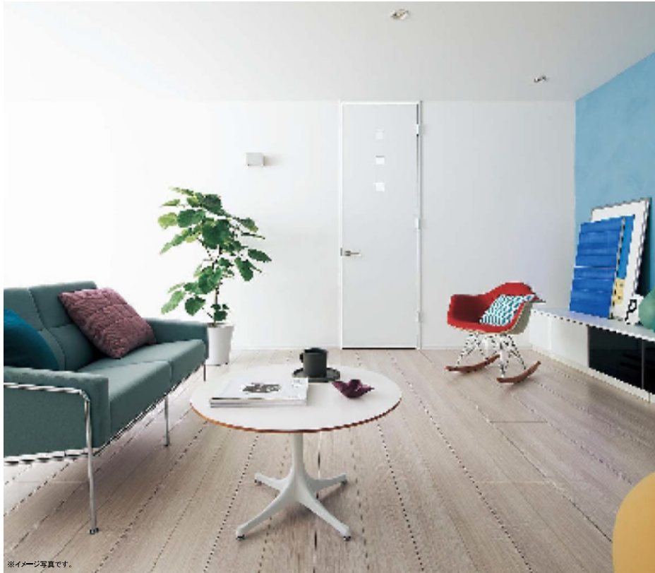
※イメージ写真です。